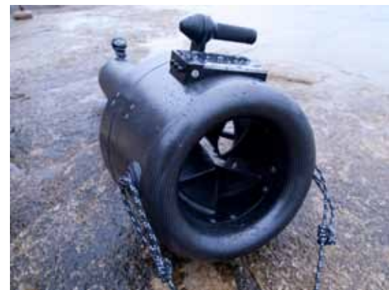
E-Motor, eingebaut in den Unterwasserscooter "Futurum"