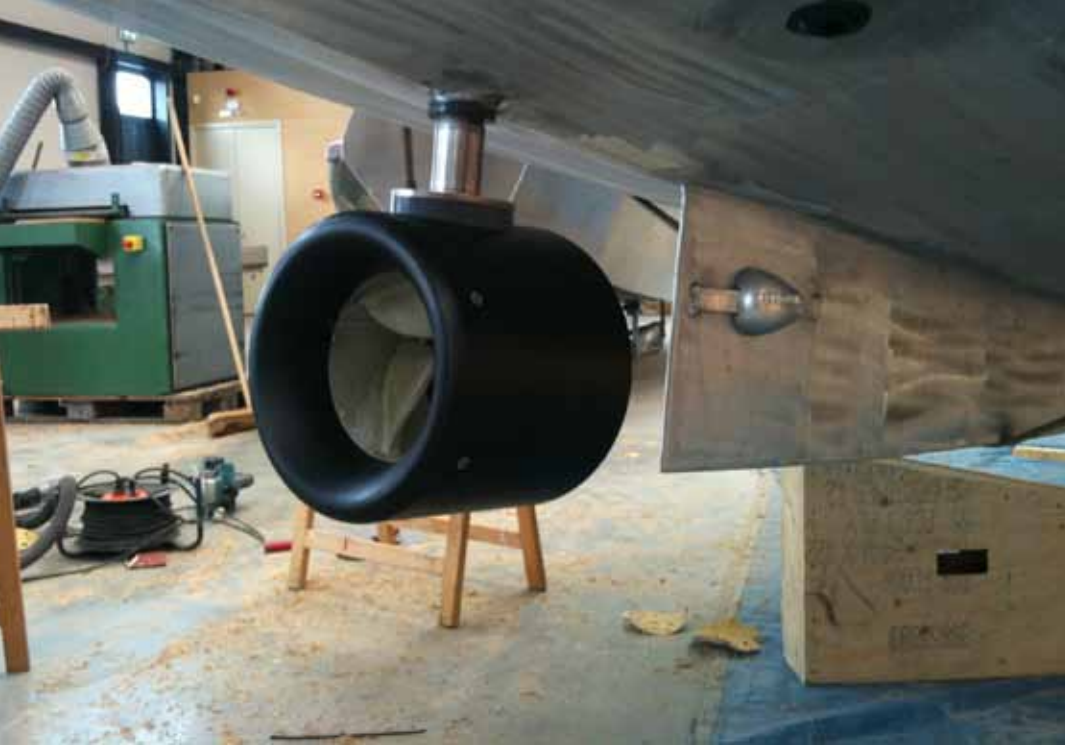
E-Motor (Größe 170), angebracht als POD Antrieb an einer holländischen Sloep

Durch die außen geführten Propeller kann darüber hinaus auf eine Nabe verzichtet und so überdurchschnittlich viel Schub erzeugt werden.